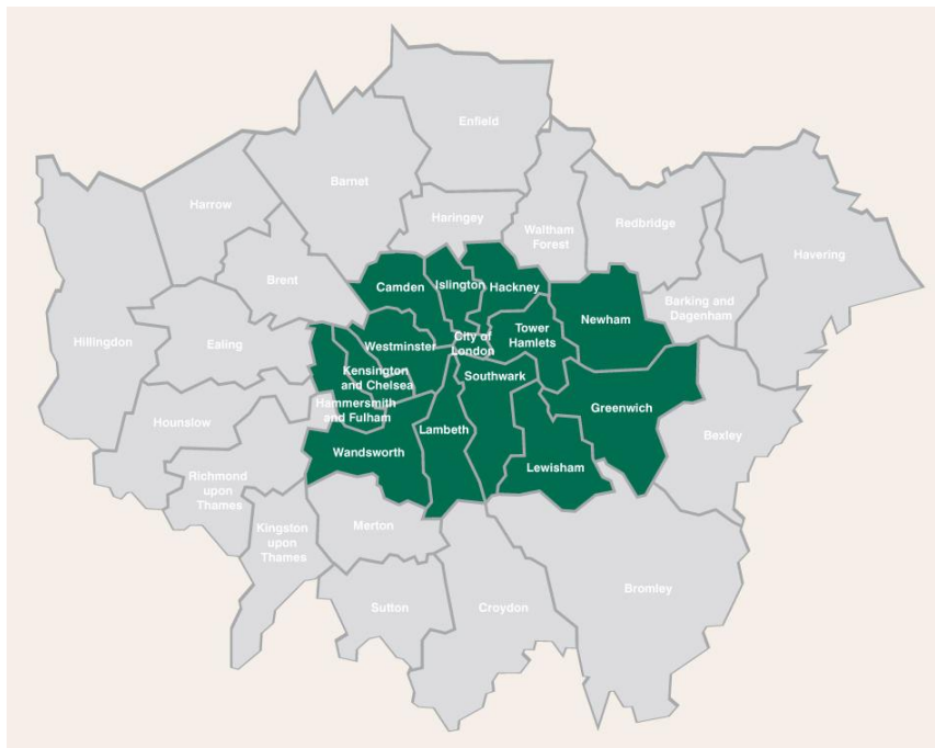
Figuur 1. Deelgemeenten (boroughs) van Londen naar Inner Londen (groen) en Outer Londen (grijs).

Londen bestaat uit 32 deelgemeenten of ‘boroughs’ die ieder bestuurd worden door een eigen deelgemeenteraad. Twaalf deelgemeenten worden gerekend tot ‘Inner Londen’ en de overige twintig vormen samen ‘Outer Londen’. Daarnaast bestaat de ‘City of Londen’ die niet tot de deelgemeenten wordt gerekend maar functioneert als ‘stad’ binnen Londen met een eigen lokale autoriteit.