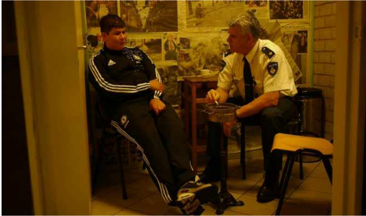
Second Wave workshop, juni 2012