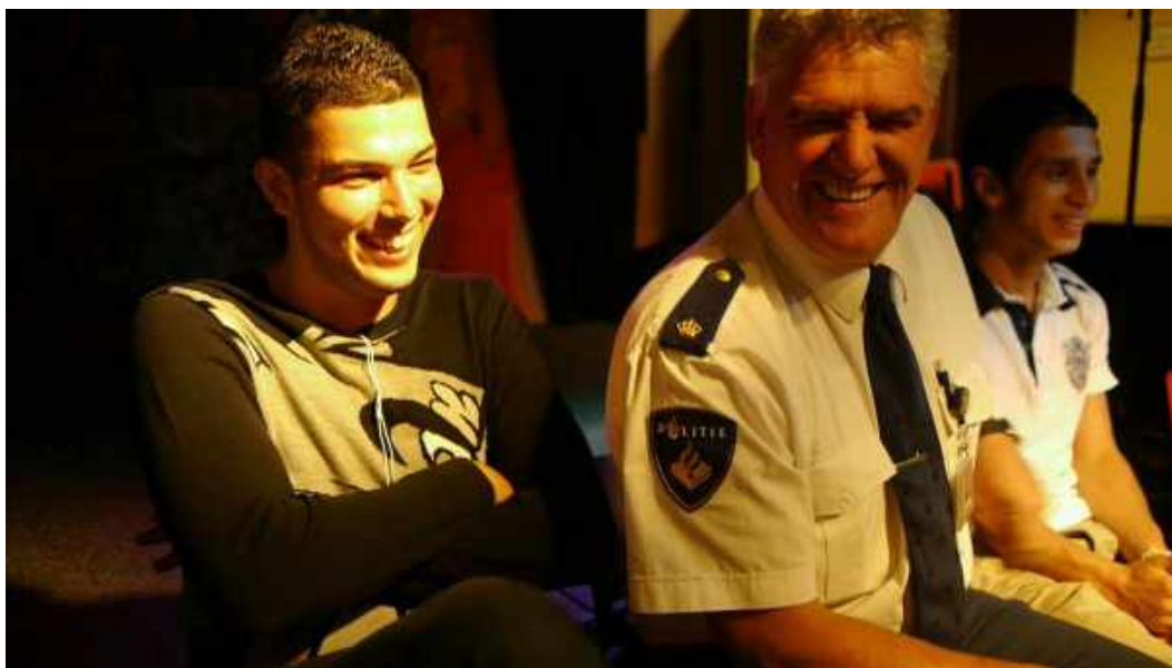
Second Wave workshop, juni 2012

Na de overval op een buschauffeur in Gouda in 2008, kwamen de Marokkaanse jongeren uit Gouda in een zeer negatief daglicht te staan. Media sprak over ‘Marokkaanse reljeugd’ en over Gouda als ‘vrijstaat voor tuig’. Oosterwei, en daarmee Gouda, lag onder het vergrootglas van de media en de landelijke politiek. Er werd daadkracht verwacht van de lokale politiek en de politie. Onder deze druk werd er op alle terreinen repressief en hard opgetreden tegen vooral de Marokkaanse jeugd.