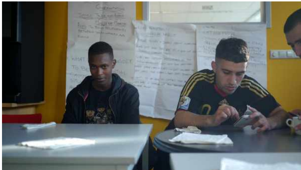
Second Wave-workshop, juni 2012

Onderzoekers hebben betoogd dat de spanning tussen politie en Nederlands-Marokkaanse jongeren problematisch is omdat ze zichzelf versterkt: de politie hanteert een selectieve benadering en focust meer op jonge Nederlands-Marokkaanse personen. Dit lokt op zijn beurt bij deze groep frustratie en ondermijnd gedrag ten opzichte van de politie uit. Wanneer ze worden geconfronteerd met dit gedrag zullen politieagenten sneller straatontmoetingen bestraffen met boetes of arrestaties en zullen ze hun aandacht nog meer op deze jongeren richten. Als gevolg van deze gespannen relatie kunnen relatief kleine incidenten dramatisch escaleren.