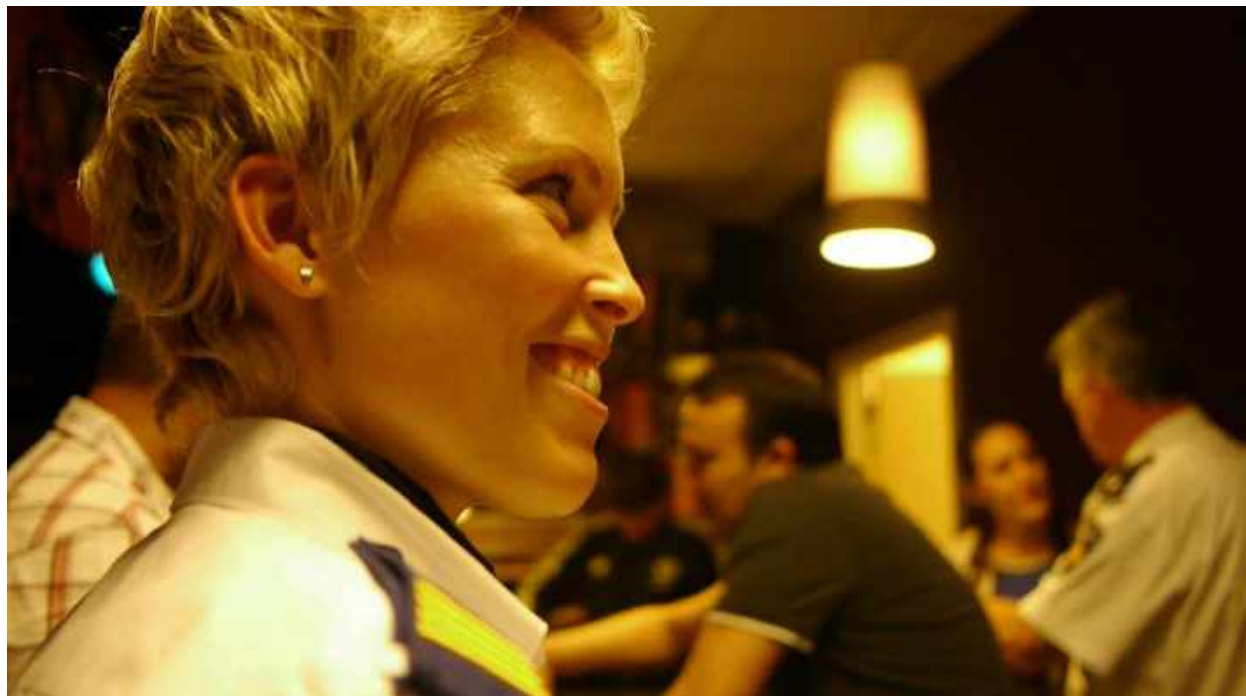
Second Wave workshop, juni 2012