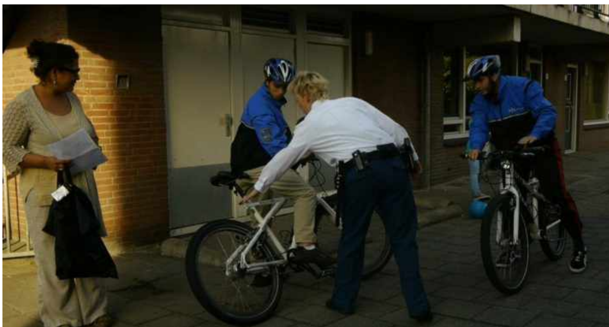
Second Wave workshop, juni 2012

De sessies werden geïnspireerd door de op toneel gebaseerde benadering die bij het nevenproject in Londen werd gebruikt. De onafhankelijke facilitators van de workshops in Gouda hadden een stevige achtergrond in theater en gebruikten derhalve technieken zoals improvisatie, vertrouwensspellen en rollenspellen. Deze benadering slaagde erin een sfeer te creëren waarin alle groepsleden het gevoel hadden erbij te horen en in contact met elkaar te staan. Een sfeer waarin barrières doorbroken worden en op een veilige maar niet-vrijblijvende manier gepraat kan worden over gevoelens en meningen aangaande gevoelige kwesties.